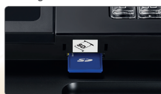
Lecteur carte SD